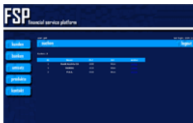
Einfache Handhabung durch ein einfach gestaltetes Menü

Sie sehen die Provision der jeweiligen Produkte, können somit überprüfen, ob das Provisionsgeschäft bereits abgewickelt wurde und durch Statistiken analysieren, welche Produkte, Kunden oder Banken Ihnen den meisten Ertrag bringen.